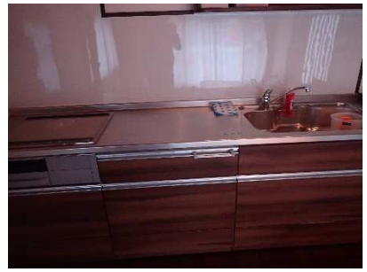
共同キッチン、洗い場