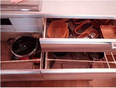
共同調理器具、食器※2