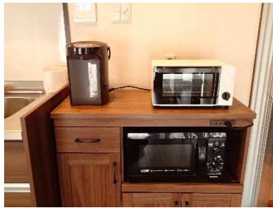
共同レンジ、トースター