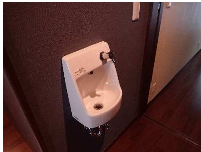
トイレ前手洗い場