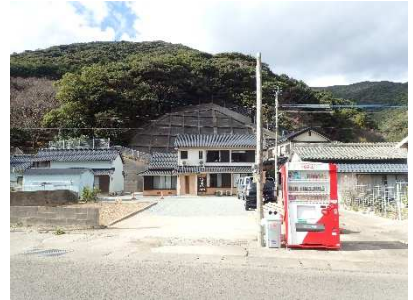
宿前の自動販売機